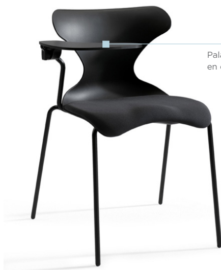
Pala escamoteable en opción