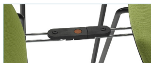
Adosable en opción